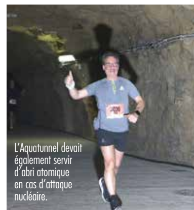
L'Aquatunnel devait également servir d'abri atomique en cas d'attaque nucléaire.