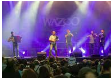
Les uns courent, les autres dansent!