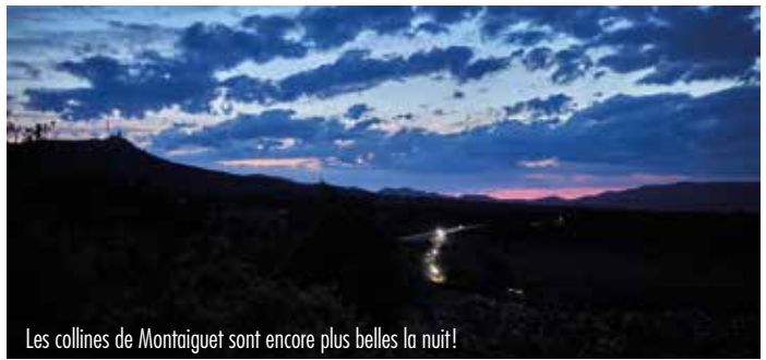
Les collines de Montaignet sont encore plus belles la nuit!