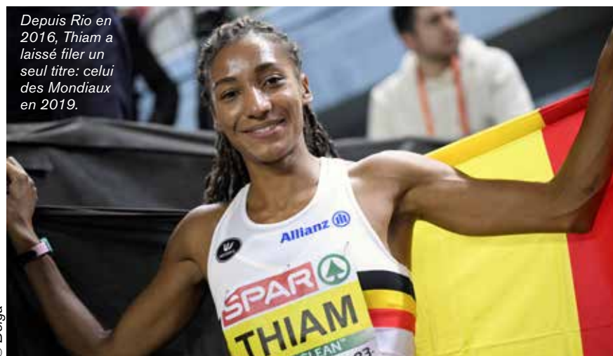
Depuis Rio en 2016, Thiam a laissé filer un seul titre: celui des Mondiaux en 2019.

Sur 400 mètres, il y a bien sûr le Norvégien Karsten Warholm, champion