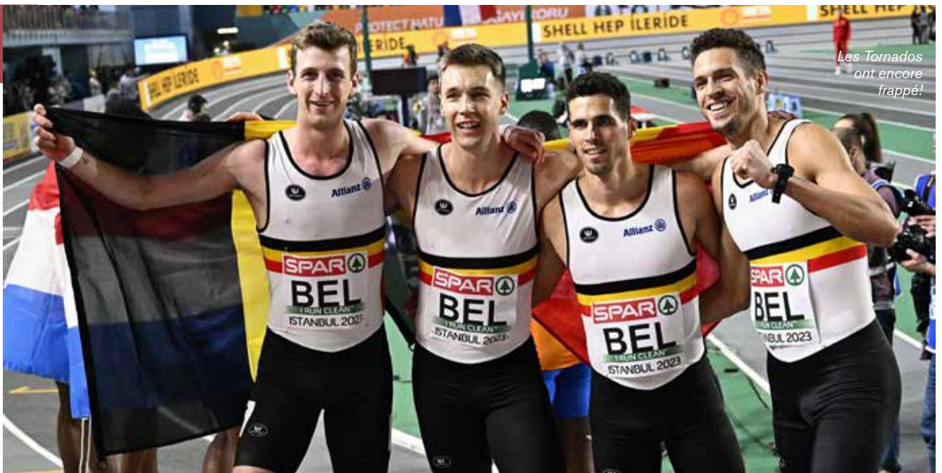
Les Tornados ont encore frappé!